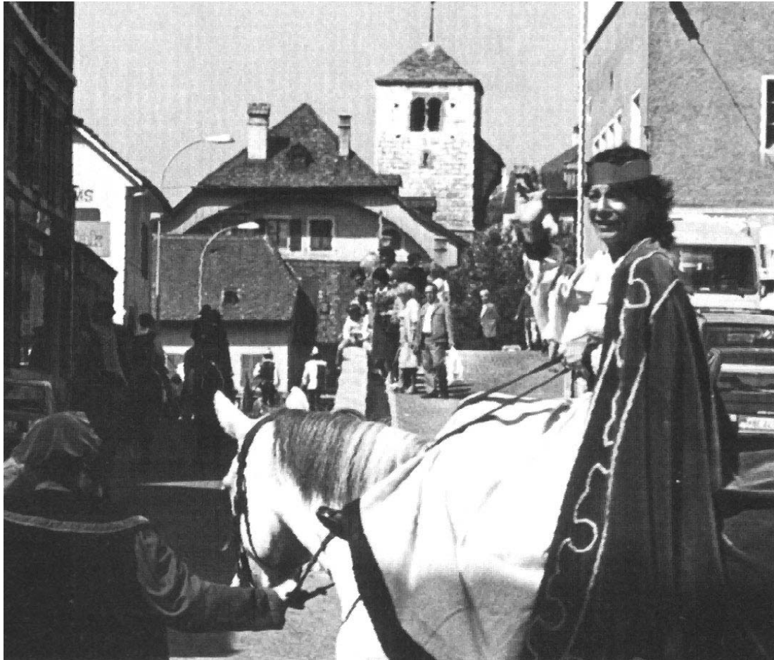
photo extraite du Livre "Images 84" 1100 e anniversaire de St-Imier

Lors du 1100 e me anniversaire de St-Imier en 1984 La Reine Berthe est venue à Cheval depuis Payerne. La voici arrivant vers le Relais culturel et la Tour St-Martin