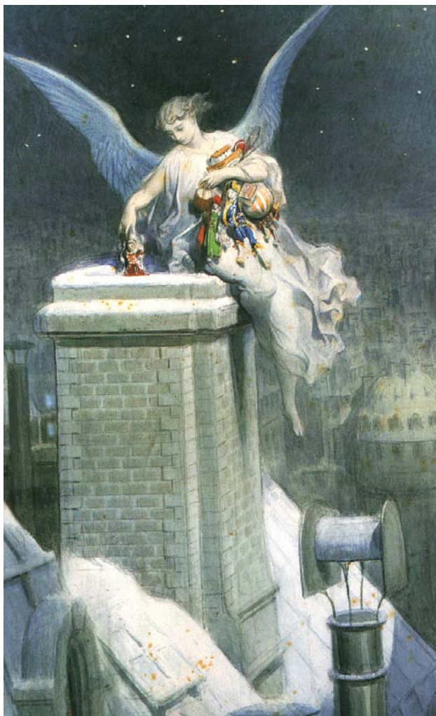
Dame de Noël, Ange ou fée ? Gustave Doré (Musée d'Orsay)