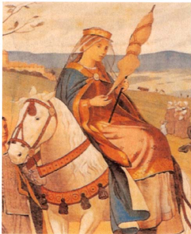
image extraite de l'exposition à la Salle Cluny à Payerne durant l'été 2002

Quand la reine Berthe chevauchait sur les chemins de Romandie