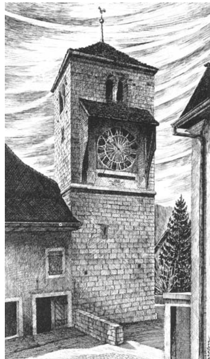
La Tour de la Reine Berthe dessin d'Aragon